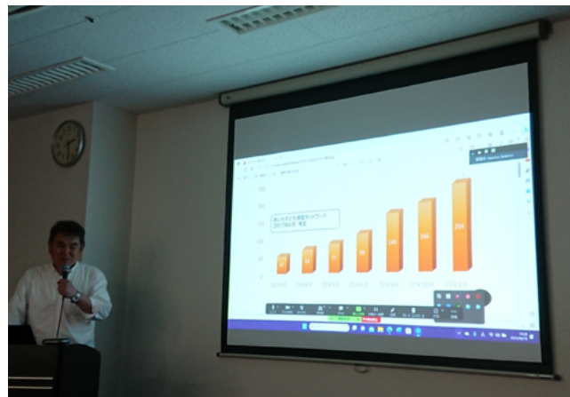
アンケート結果から見てきたことを報告

まず最初に、忠平代表から、今年4月に行った会員の2022年度活動アンケートの集計結果が報告されました。会員の活動月の報告から、毎月、何らかの取り組みを進めている子ども食堂が多かったことなど、色々と制約がある中で、会員の皆さんの熱心な取り組み状況をうかがい知ることができました。